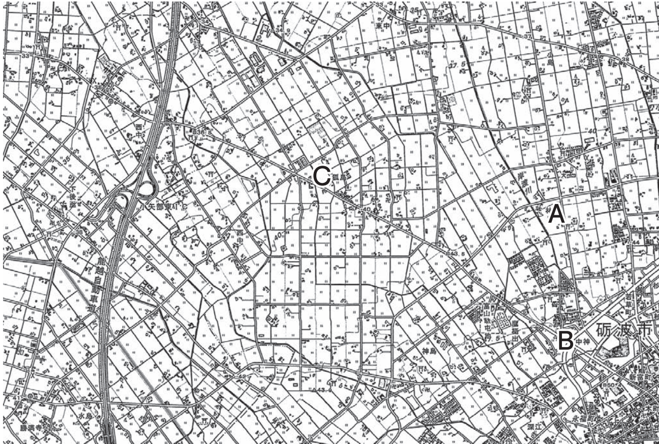
(国土地理院発行 2万5千分の1地形図「砺波」平成28年発行 一部改変)