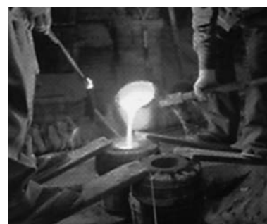
鑄込みによる成形