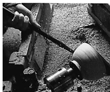
ろくろによる木材の成形